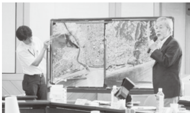
▲首長懇談会での発言の様子