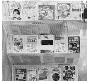
▲宿題・自由研究 役立ちコーナー