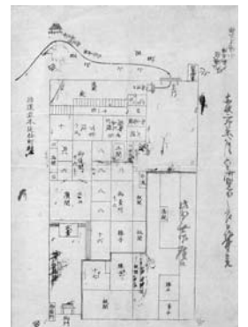
▲小島本陣の間取図

大名とつながりがあった本陣には、ゆかりのお宝が伝えられています。休泊中に詠まれた俳句の短冊や絵は、本陣の家に代々伝えられ、大切に保管されました。