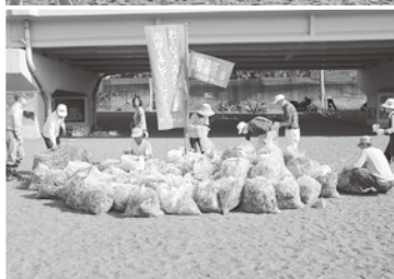
大勢の方が参加した美化キャンペーン(北浜海岸)

「町ぐるみ美化キャンペーン」を5月27日(日)に実施しました。 当日は、多くの町民の皆さんやさまざまな団体の方に参加いただき、ありがとうございました。 海岸、河川、公園、駅周辺やハイキングコースなどに散乱するごみが拾われ、町がきれいになりました。