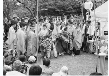
▲国府祭「座問答」の様子