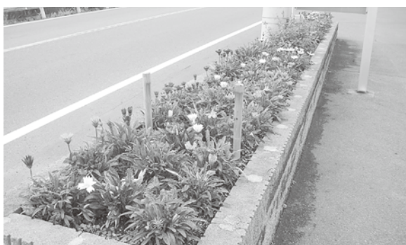
▲花いっぱい運動団体の活動できれいに整備された花壇