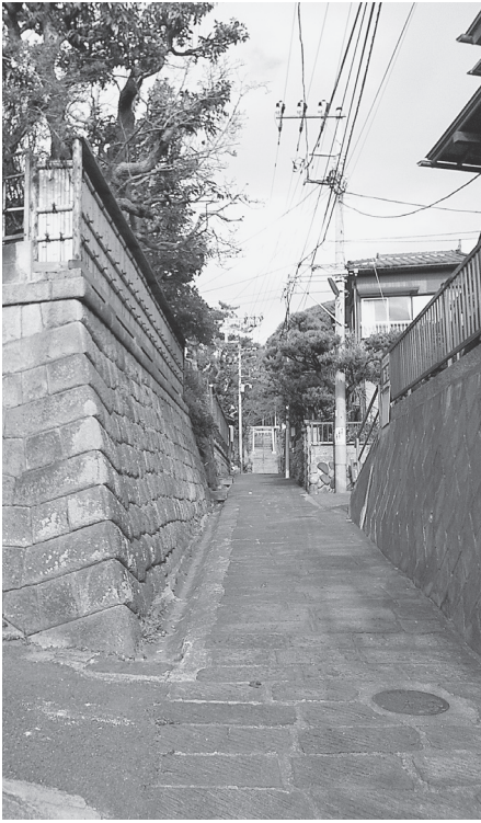
▲愛宕神社周辺の小路