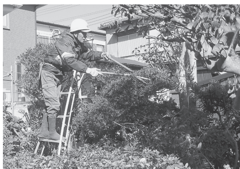
▲植木剪定の作業風景