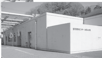
▲町世代交流センター内にある同事務所