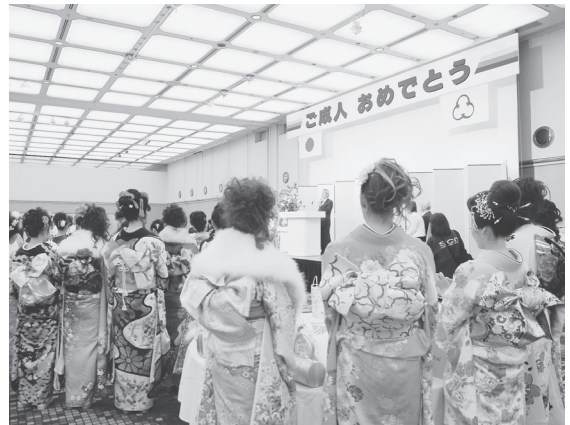
▲成人式のようす(昨年)

▼対象 平成3年4月2日～平成4年4月1日生まれで、平成23年12月1日現在大磯町に住民票のある方