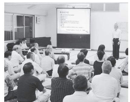
▲卓話集会の様子（国府新宿）