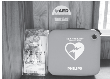
▲各地区に設置されたAED