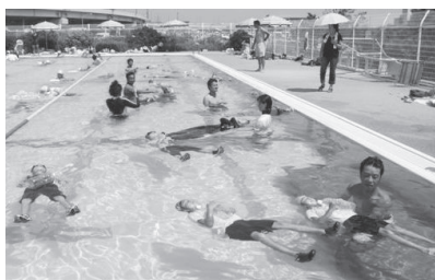
▲着衣泳体験会の様子(昨年)