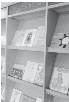
▲よんでみよう50冊の本（いそちゃんコーナー）

本館いそちゃんコーナーの壁面に、今年もおすすめの絵本を50冊用意しました。時間のゆとりがある夏休みに、お子さんへの読み聞かせや、ひとり読みのスタートなどにぜひご利用ください。