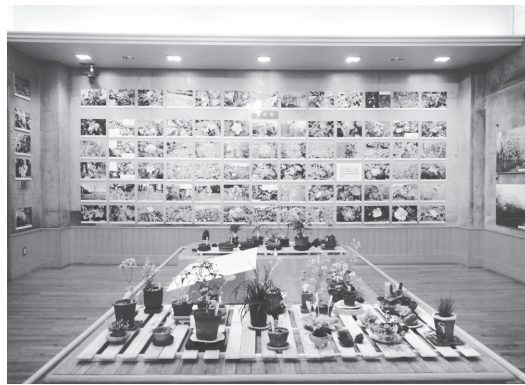
▲企画展の展示風景(昨年)

町民、近隣市町在住の方に参加を募り、本町における夏の草花・樹木の分布調査を行いました。展示ではヒルガオ属、ウツギ属、ミズキ属の植物や夏の七草の分布状況などを紹介しています。夏季、町のどこで、どんな植物が見られるか、展示を通してご覧ください。