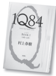
▲ミリオンセラーとなった1Q84 BOOK1