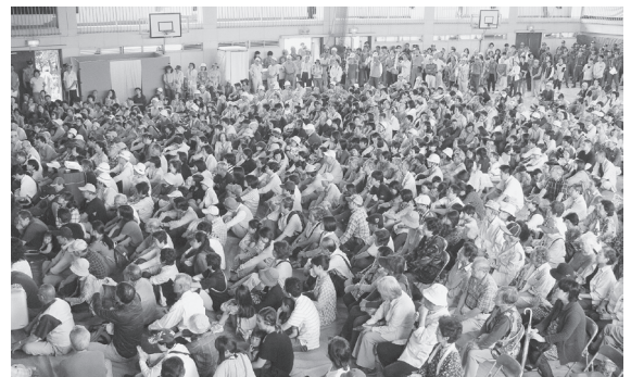
▲大磯小学校体育館に避難する様子

訓練では避難行動に重点を置き、自治会で選定した高台の一時避難場所や避難経路などを確認する実践的訓練を行いました。当日は、午前9時の防災行政無線での大津波警報のサイレンを合図に東部地区10自治会、海