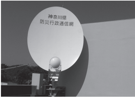
▲町役場屋上の衛星通信用アンテナ

このシステムは、通信衛星と町の防災行政無線を利用し、緊急情報を町民へ瞬時に伝達するものです。これらの情報が放送された時は、テレビやラジオをつけて情報に注意し、身の安全を確保して落ち着いて行動するようにしましょう。