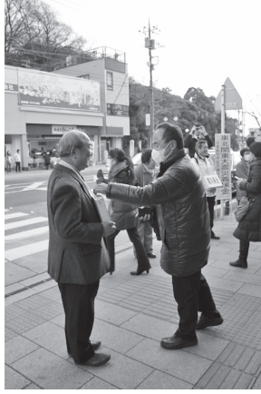
▲被災地支援の募金活動を行う参加者の皆さん

東北関東大震災で被災された方々への支援活動の一環として、3月17日（木）、大磯町長をはじめ、大磯町議会議員や大磯町区長連絡協議会、民生委員児童委員連絡協議会などが参加し、大磯駅前街頭募金活動を実施しました。今後、被災地復興のため、町として積極的に支援活動を実施していきます。