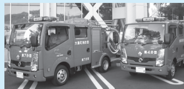
▲更新された消防自動車

消防団第4分団(西小磯東西小磯西と消防管轄)と消防団第7分団(生沢を管轄)の消防自動車を更新しました。