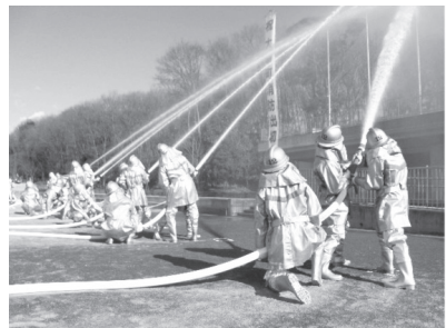
▲昨年の出初式の様子