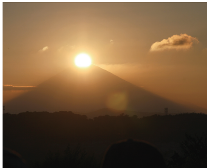
① ダイヤモンド富士 (9/1・大磯城山公園)