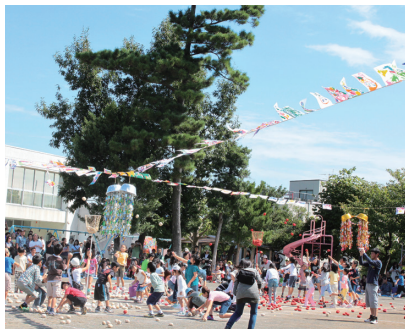
③ どっちもガンバレ〜 (9/25・大磯幼稚園)