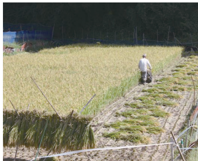
④ 稲刈りの様子 (9/26・西小磯)