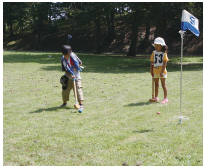
② 上手に打てたね!【ファミリーグラウンドゴルフ大会】(9/5・大磯城山公園)