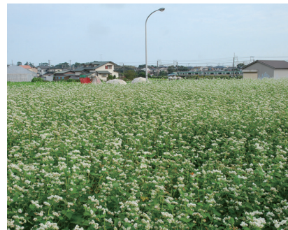
⑤ そばの花 (10/17・西小磯)