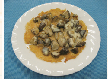
写真・レシピ提供 大磯町食生活改善推進団体(ママの会)