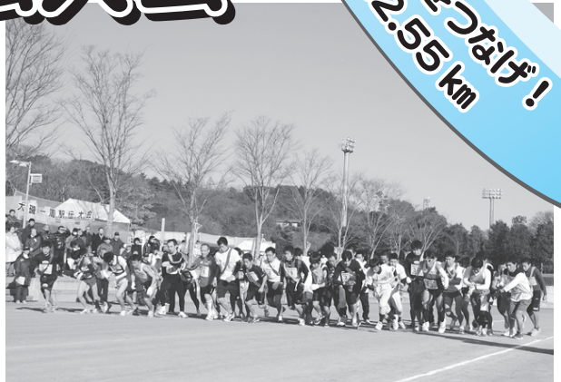
▲スタート時の写真(昨年)