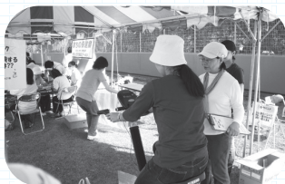
▲筋力トレーニング体験