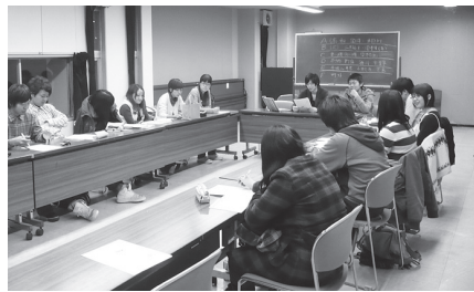
▲昨年の実行委員会の様子

▶ 対象 平成23年1月に成人式を迎える方(平成2年4月2日～平成3年4月1日生まれの方)