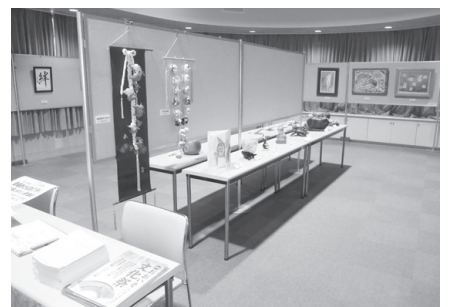
▲昨年の「おおいそ美術展」