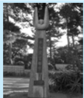
▲本庁舎敷地内にある平和記念碑