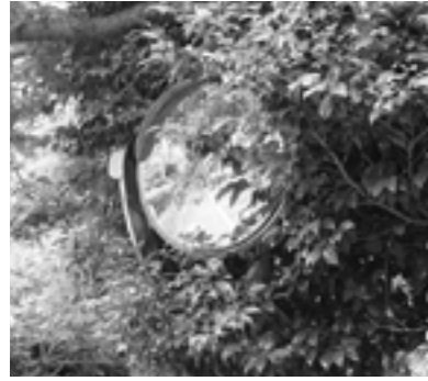
▲枝で見えにくくなったカーブミラー

町でも定期的に管理を行っているところですが、ご自宅に隣接して防犯灯やカーブミラーの設置がある場合は、樹木の枝下ろしにご協力をお願いします。