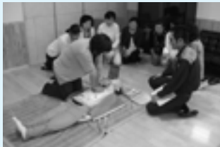
▲普通救命講習の様子

▼申込み 受講を希望される方は7月31日(土)までに消防署へご連絡下さい。定員になり次第、締め切らせていただきます。