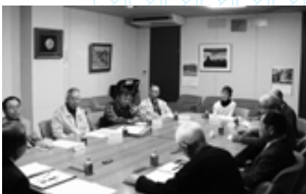
▲安全防犯活動をしている方と語り合う様子