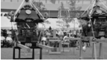
▲昨年度の海開きの様子