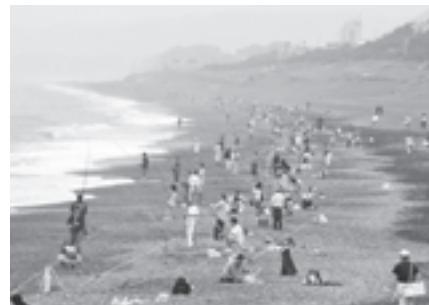
▲たくさんの人が参加した白キス投釣大会(昨年度)の様子