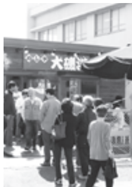
▲店の外に行列ができる「めしや大磯港」