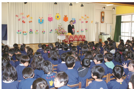
③ たくさん友だち作るうね (4/7・大磯幼稚園入園式)