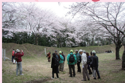
④ 春に誘われて (4/4・神揃山)