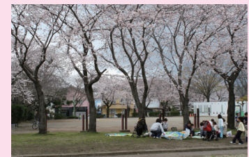
⑤ お花見って楽しい! (4/1・馬場公園)