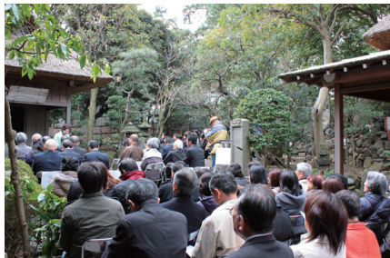
① 多くの人に参加した西行祭 (3/28・嶋立庵)