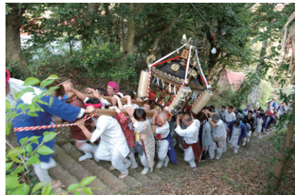
② 勇ましく進むおみこし (4/11・寺坂の春祭り)