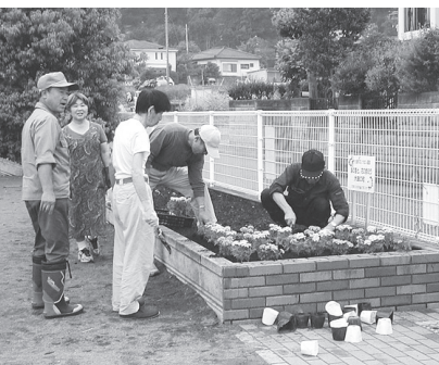
▲花を植えるボランティアの方(森下公園)

花に親しむ機会を増やし、こころのやすらぎと美化意識の高揚を図ることを目的として、花いっぱい運動を推進しています。「花のボランティア」として協力していただける団体(在住・在勤・在学の方で組織していること)を募集します。