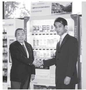
▲自動販売機前で握手をする三好町長(写真左)と郡所長