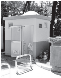
▲明るくきれいに整備された東町3丁目公園のトイレ

便室内にトップライトを取り付け内部を明るくし、また、手すりを設けるなどバリアフリー化にも配慮しています。