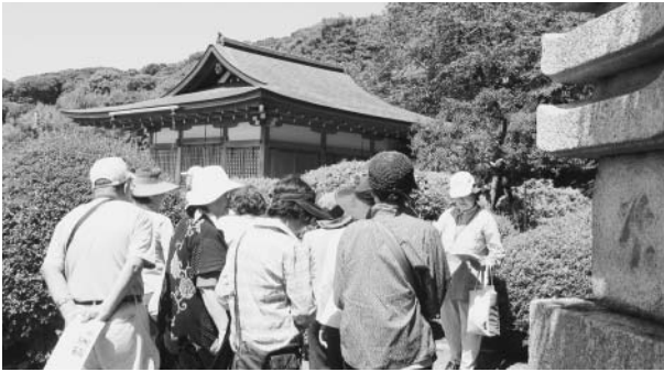
▲旧安田邸のお庭散策のようす(昨年度)

▼内容 旧安田邸のお茶室でお点前を楽しむ↓旧安田邸のお庭案内↓町内の旧跡案内↓翠溪荘のお庭案内↓解散