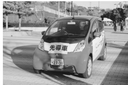
▲大磯一周駅伝大会の先導車として使用した電気自動車