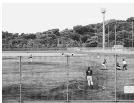
▲運動公園野球場で行われた軟式野球の試合

このため、球場周辺施設への安全性を高め、かつ硬式野球もできる球場として、安心して使用できるように防球ネット・バックスクリーン等の改修を計画しています。