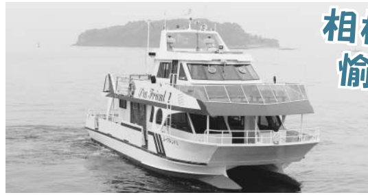
▲船舶シーフレンド1