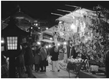
▲六所神社だるま市の様子