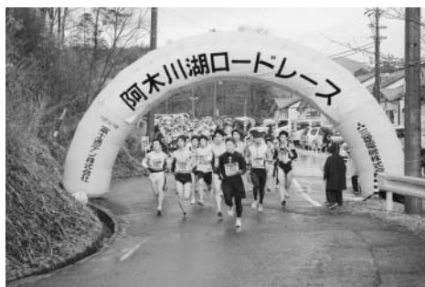
▲昨年行われたロードレースの様子

▼参加資格 ・男子 昭和26年4月1日生以前 ・女子 昭和36年4月1日生以前 ▼参加料 3,000円 ▼申込締切 3月1日(月) ▼申込書の請求及び問い合わせ 実行委員会事務局 ☎573(75)3335