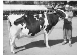
▲名号 バリエント ビンセント ルドルフ (第6類)