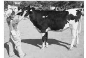
▲名号 サンハイ アイデアル ウインチェス ブレイク (第2類)