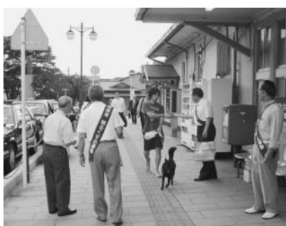
▲大磯駅前での啓発活動

「社会を明るくする運動」は、犯罪や非行の防止と、罪を犯した人たちの更生についての理解を深めるための全国的な運動です。7月の強化月間に合わせ、町では、保護司会、更生保護女性会、民生委員児童委員協議会、青少年指導員連絡協議会、町立学校PTA連絡協議会、大磯警察署、少年補導員連絡会のご協力を得て、7月1日、26日に街頭啓発活動を実施しました。今後とも、同運動にご理解ご協力をお願いいたします。