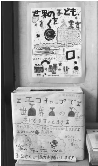
▲図書館に設置された回収箱