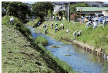
③美化キャンペーン・月京(6/1)