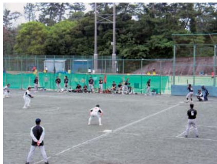
⑤町民春季男子ソフトボール大会(6/8)