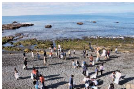
④美化キャンペーン・照ヶ崎(6/1)