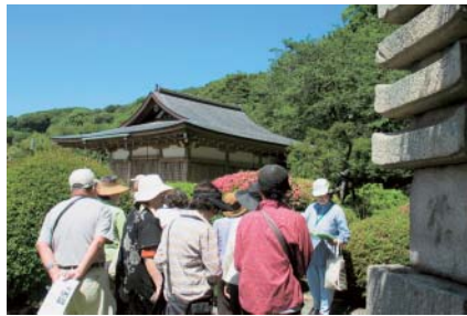
②邸園文化交流園・大磯 春(6/1)