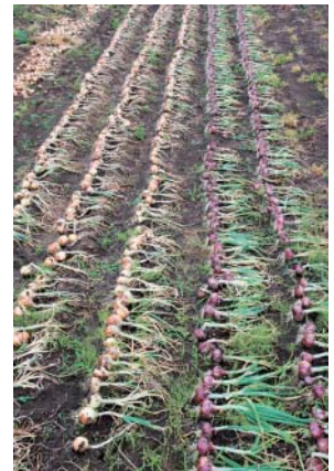
⑥玉ねぎの収穫・国府 本郷(6/5)