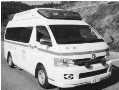
▲寄贈された救急自動車

消防署では寄贈された高規格救急自動車でも一人でも多くの命を救えるよう、日頃より訓練、研さんを積み重ね、職員一丸となって救命率の向上に努めてまいります。