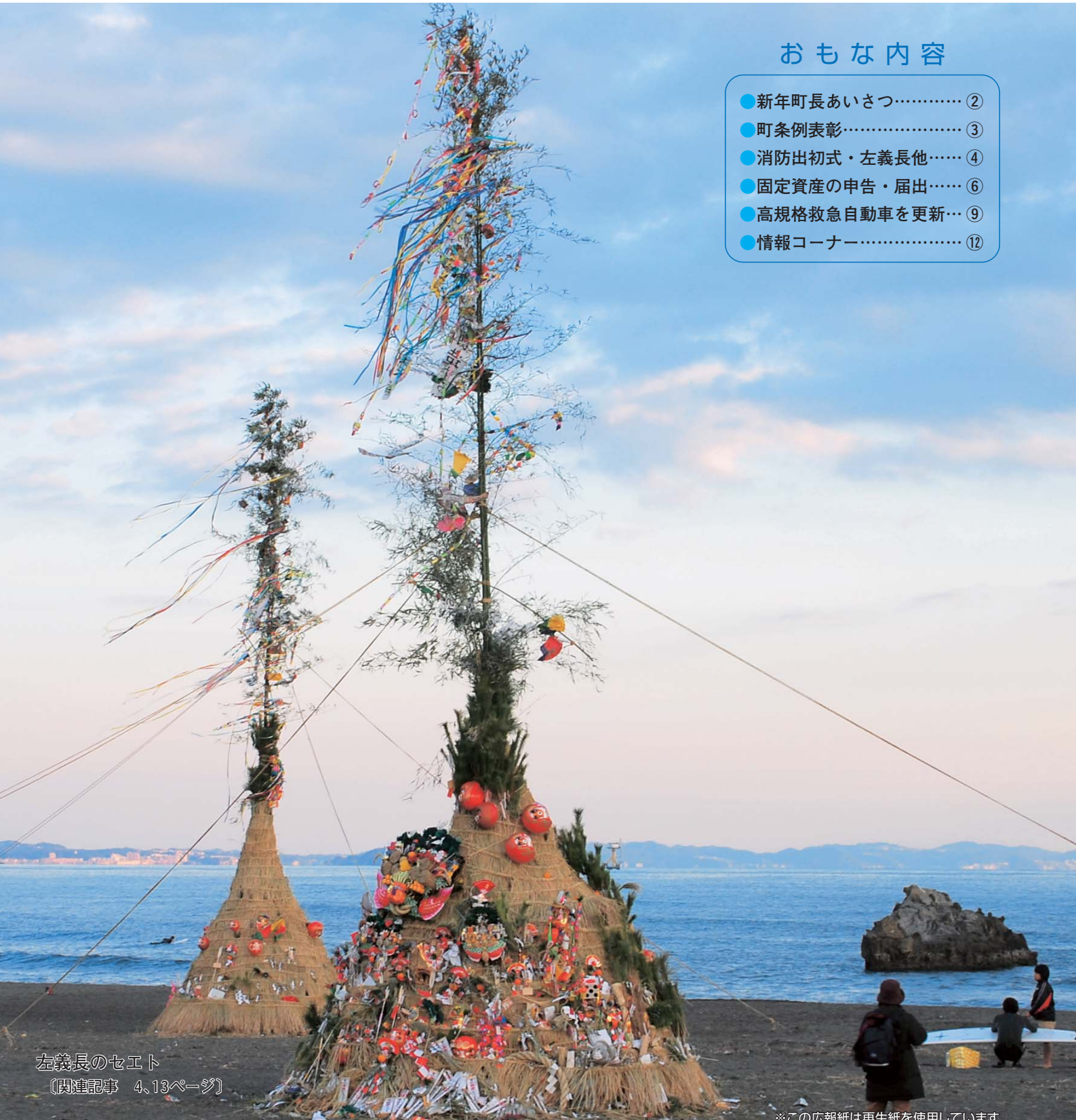
左義長のセイト (関連記事 4、13ページ)