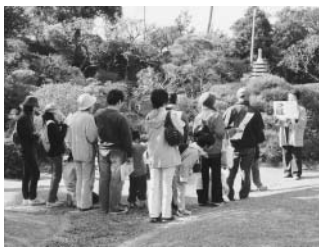
▲邸内をスタンプラリーで回りました