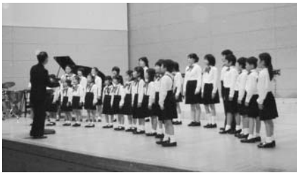
▲大磯小学校の合唱

すごいなと思った学校は、国府中学校のすいそ楽の人たちです。ダンスをしながらえんそうしていました。最後に大人のクラリネット四重奏の人が「ぜんまい