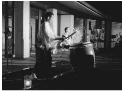
▲お月見コンサート

郷土資料館で行われたオーブンガーデンフェスタに行き、津軽三味線と和太鼓の演奏をきき