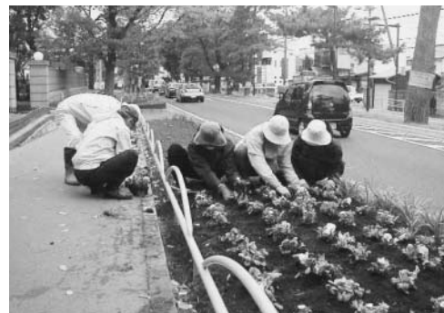
▲花のボランティアが植栽

「花のボランティア」として協力していただける団体(在住・在勤・在学の方で組織していること)がありましたら、ぜひ、ご連絡ください。