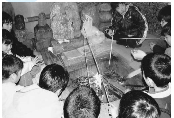
▲道祖神小屋でのお籠り