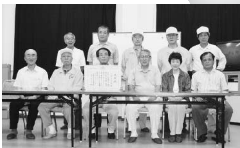
▲受賞した石神台自治会のみなさん

石神台自治会は17年度事業として、地域内の防犯灯の整備拡充を行いました。また、日頃より自治会有志で組織する「石神台ガーディアン」としてパトロール等防犯に取り組んでいます。