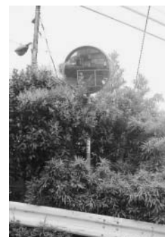
▲見えにくくなったカーブミラー