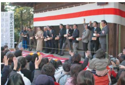
●六所神社節分祭 (2月3日) 今年の福をつかめたかな!?