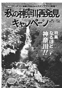
▲インビテーションブック

「秋の神奈川再発見キャンペーン」がいよいよはじまります。市町村、各観光協会、民間事業者などと連携し、多くの皆さんに楽しい秋の神奈川を満喫していただけるよう、今年も魅力満載の冊子「インビテーションブック」を用意しました。今年、特集ページ「なるほど 神奈川!!」で、神奈川の再発見につながる話題をご紹介します。ほか、楽しい思い出や愉快なシーン、美しい風景を写真に撮って応募していただくフォトコンテストも実施します。