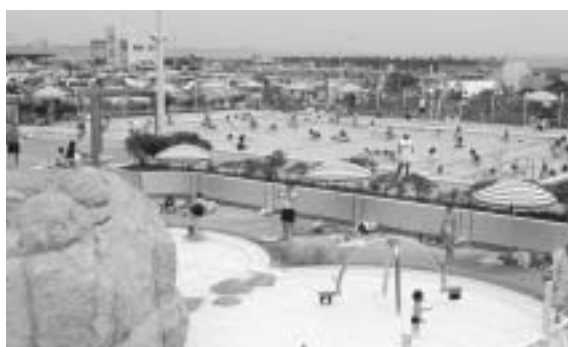
▲町営照ヶ崎プール

なお、両プールでは、小・中学校の水泳教室が実施される期間は、専用使用となります。専用日時等詳細につきましては、7月号にてお知らせします。