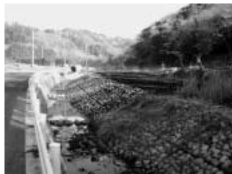
農とみどりの整備事業