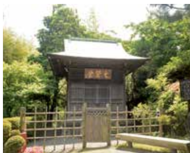
旧吉田茂邸七賢堂 (明治36年頃建築)