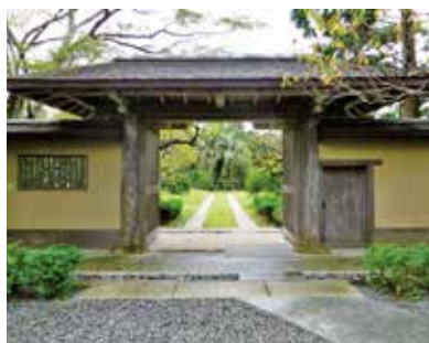
旧吉田茂邸兜門 (昭和29年建築)