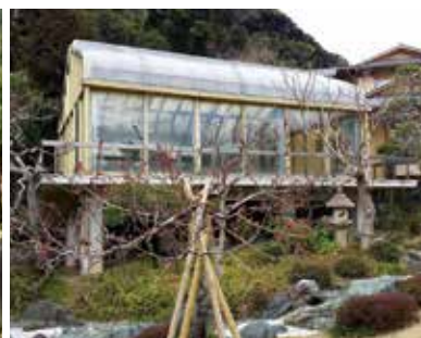
旧吉田茂邸サンルーム (昭和38年建築)