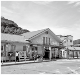
問都市計画課 ☎内線243

町では、平成29年度に、学識経験者や地元関係者の皆さんとともに、「(仮称)大磯駅周辺安全安心・にぎわい創出計画(案)検討会議」を設置し、アンケート調査により広く皆さんご意見を伺いながら、駅前広場の再整備を中心とした課題の抽出や対応策の検討を行ってきました。今後、検討会議での検討内容を基本に、関係機関との協議などを経て、「大磯駅周辺安全安心・にぎわい創出計画」を策定してまいります。これまでの検討経緯や現時点での整備計画案な