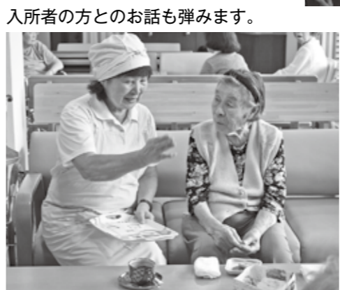
入所者の方のお話も弾みます。

月に1度、「介護老人保健施設大磯幸寿苑」では、はつらつサポーターが喫茶の運営補助として、コーヒーを入所者の方にお出しする活動をされています。 香ばしいコーヒーの香りに誘われて、続々と喫茶コーナーに集まってこられる入所者の皆さんの、にこやかな笑顔が印象的です。