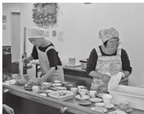
大磯幸寿苑の喫茶コーナーで、入所者の方にお出しするコーヒーの準備をしています。コーヒーのいい香りがただよってきます。

◎大磯はつらつサポーターに登録して、地域で活動してみませんか？ 町内にある介護保険施設等の14施設で、お茶だしや行事の手伝い、洗濯物の整理などの活動を行います。 平成29年8月現在、男女30名の方が登録され、高齢者の方が熱心に活動をされています。 知識や経験を生かしながら、ご自身の介護予防を推進することを目的とした事業です。 空いた時間を利用して地域に貢献し、元気とポイントを蓄積しませんか？