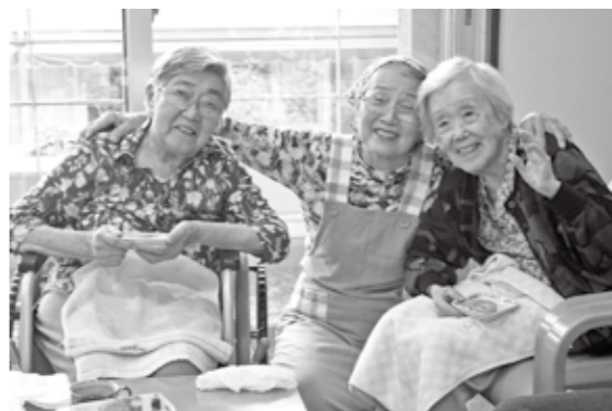
はつらつサポーターと入所者の方の間には、笑顔と笑い声があふれています。

入所者の方の声 ●今日はコーヒーの日だなと朝からワクワクして、少しおめかしをして来ました。 ●来てくださることがありがたい、晴れ晴れと明るい気持ちになれます。 ●コーヒーの日は特別な日なので、みんなで楽しみにしています。これからもぜひ続けてほしいです。