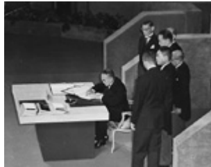
左: イギリス大使時代(昭和10年代) 右: サンフランシスコ講和条約調印(昭和26年)