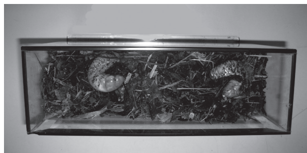
生体展示予定だった水槽とカブトムシ

三つ目は「土の中の幼虫の見せ方」です。土の中の幼虫を観察できるよう、幅の狭い水槽で幼虫を飼育しました。カブトムシは蛹になる時には蛹室という10cm程度の楕円形の空間を作ります。蛹室の中が見えると、幼虫が前蛹→蛹→成虫と変化していく様子も観察できます。今回使用した水槽は幅9cmで、幼虫は見える時と見えづらい時がありました。また、蛹室もガラス面に接していたものの、接する面が少なかつたため、よく見えるとは言えない状況でした。