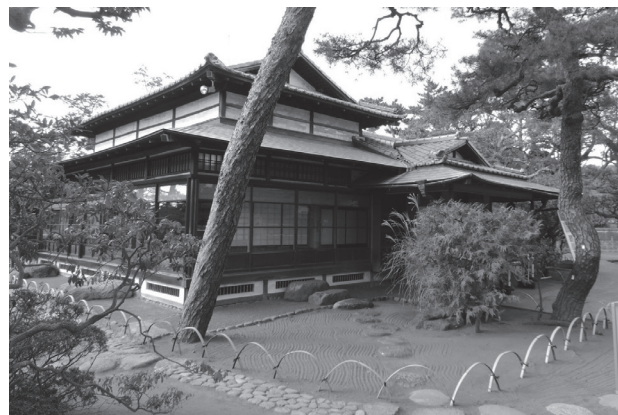
陸奥宗光別邸跡・旧古河別邸