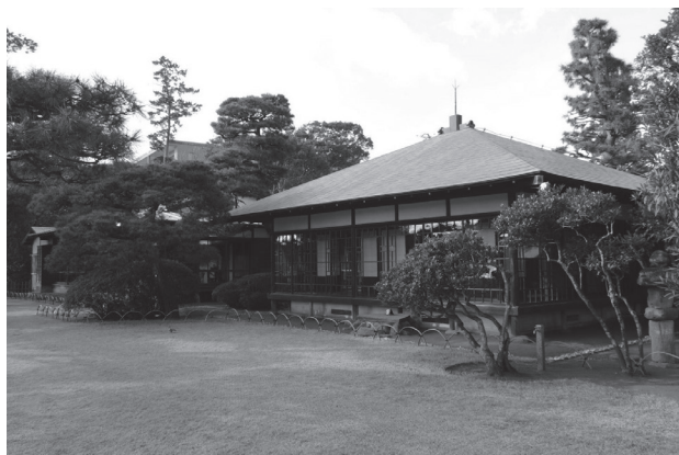
旧大隈重信別邸・旧古河別邸

「旧大隈重信別邸・旧古河別邸」は、明治30（1897）年に大隈重信が別荘として購入し、明治34年に古河家に継承された建物です。外観等に改造が施されたものの、大広間、北座敷、神代の中の3棟を中心に大隈別邸当時の建築が現存しています。構造および内部は当初の趣をよく伝え、雁行型の配置や銘木を使いながらも落ち着いた設えに、海浜別荘らしい特徴がみられます。創建は明治30年よりさらに遡る可能性があり、海浜別荘地・大磯の草創期の別荘建築として貴重であることから指定されました。