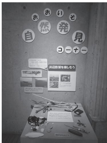
大磯自然発見コーナーの様子

郷土資料館では令和元（2019）年度より、廻廊において、季節展示「大磯自然発見コーナー」を開設しています。このコーナーでは県立大磯城山公園や里山・海など身近な自然を知って、興味を持って