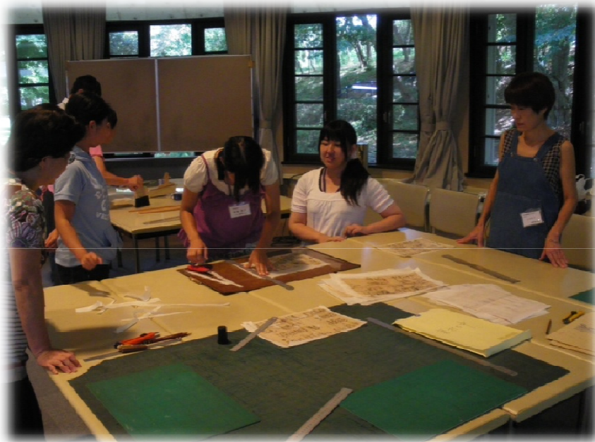
資料整理サポーター